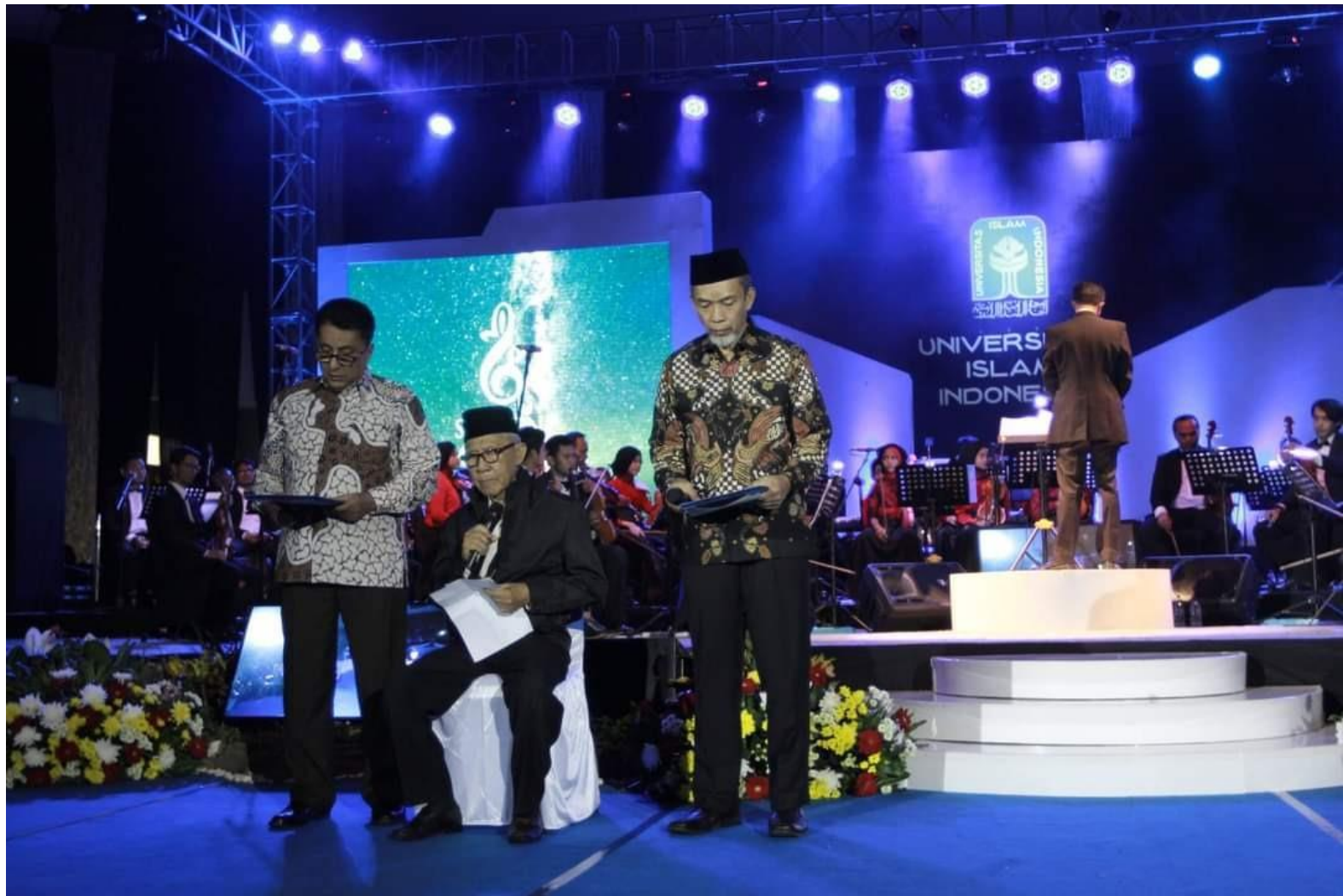
Pembacaan Puisi Bersama Rektor dan mantan Rektor, Konser Simfoni Semesta Alam