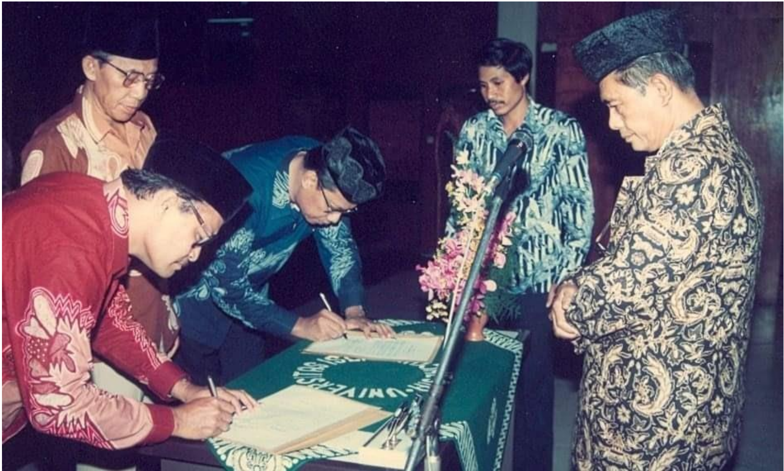
Bersama Dr. Syafii Maarif dan Dr. Zanzawi Soejoeti Dilantik sebagai pimpinan Presidium UII (Nov-Des 1989)